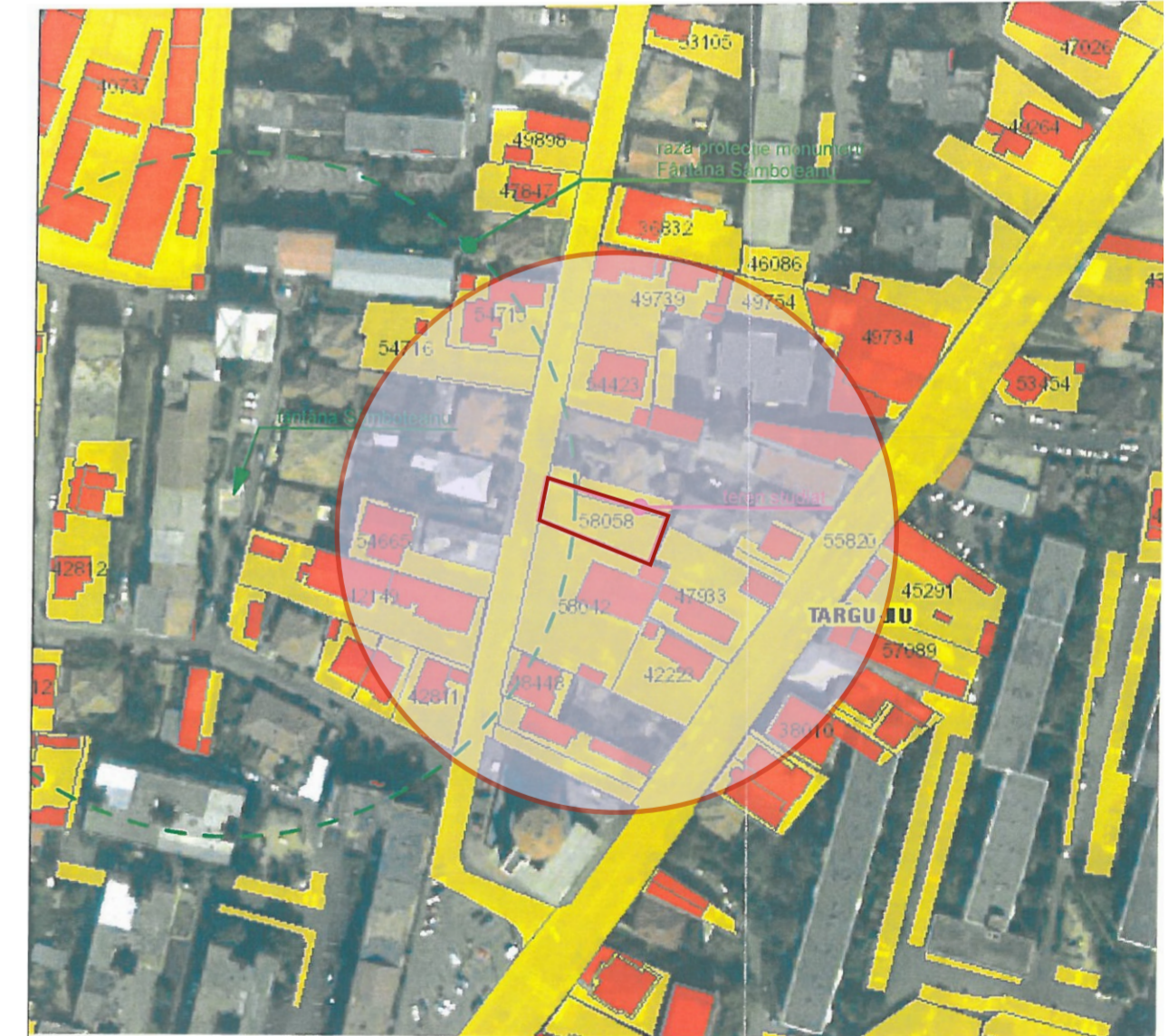
PLAN INCADRARE 1:2000